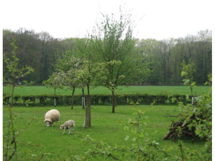
Hoogstamboomgaard met heg