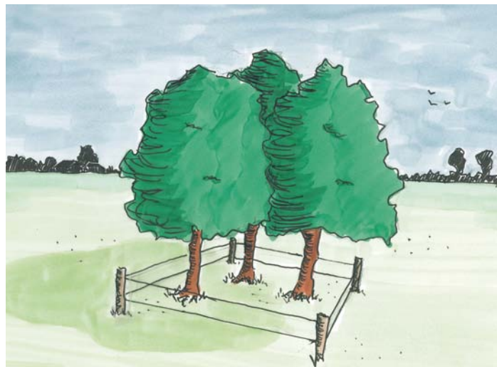
Bomengroep met raster

Na drie jaar dient u te beginnen met het opkronen, om ervoor te zorgen dat de kroon en het verkeer geen last van elkaar hebben. Het is belangrijk om iedere 3-5 jaar veiligheidscontroles uit te voeren om te bepalen of begeleidingssnoei of kroonsnoei nodig is.