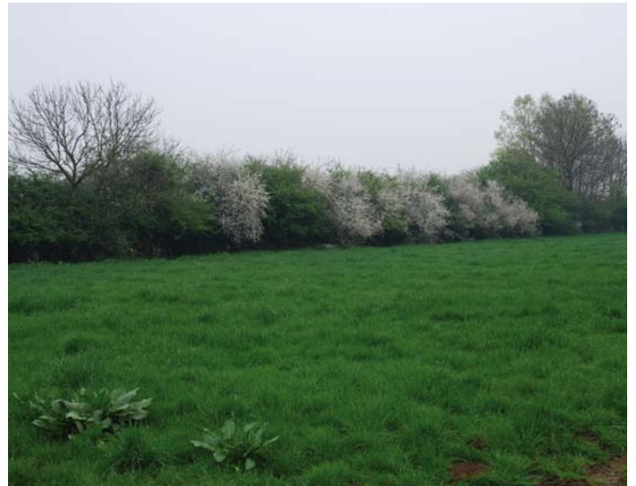
Vrij uitgroeiende haag