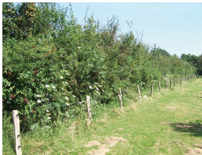
Haag met een raster ervoor

Vlechten kunnen we grofweg in twee grote groepen verdelen; namelijk het leggen en het invlechten van een haag. Invlechten gebeurt door middel van het inhakken en ombuigen van takken. Leggen gebeurt door het inhakken en ombuigen van een hele struik. Meer informatie over vlechtingen kunt u vinden op de website www.heggen.nu .