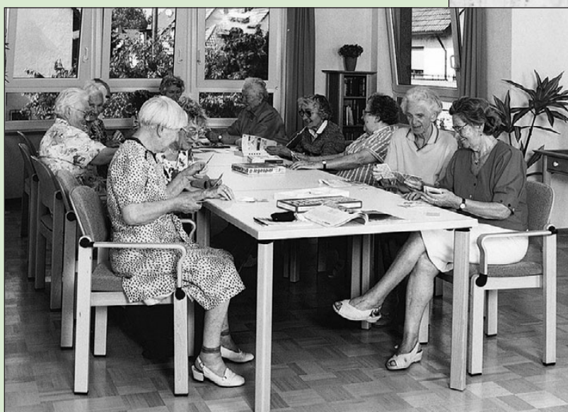
• Bij groepswonen voor ouderen is vaak ook gelegenheid voor gezamenlijke activiteiten