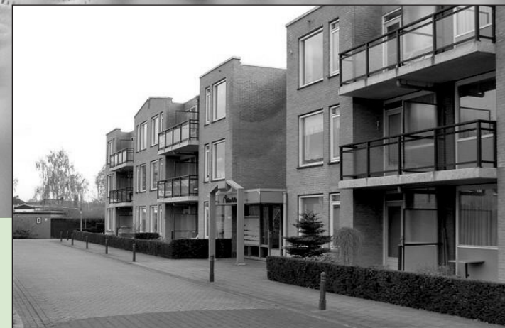
• Locatie groepswonen voor ouderen in Winterswijk

Gemeente Oude IJsselstreek bellen? 292 292