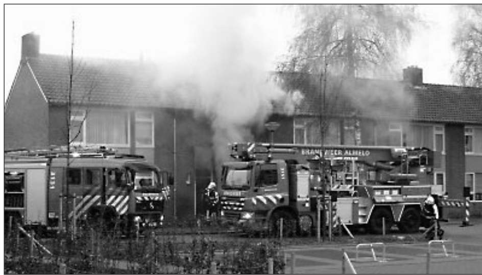
• Voorkom dat uw burens de rookmelders worden.

De brandweer komt naar je toe deze herfst