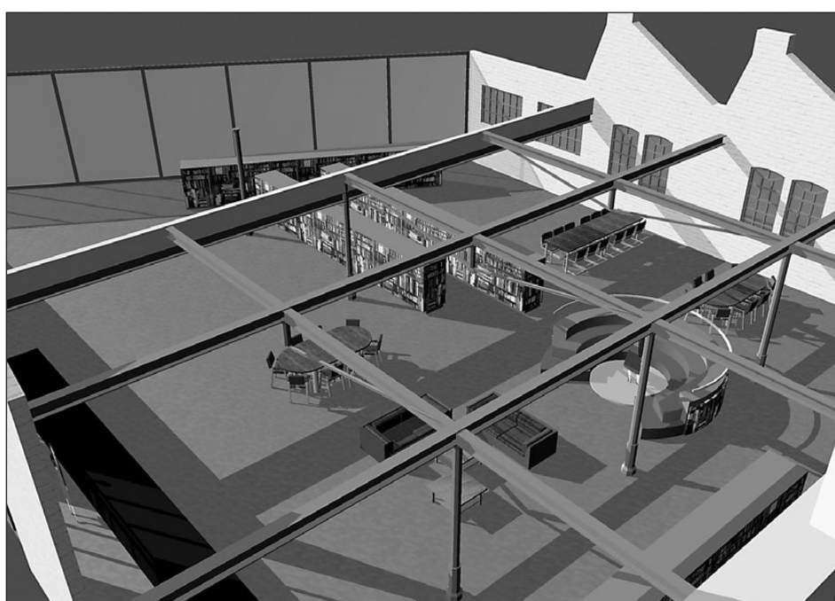
• De bibliotheek in Het Gietelink zoals deze er na de restauratie uit kan komen te zien.

De volledige besluitenlijst van het college van burgemeester en wethouders staat op onze website: www.oude-ijsselstreek.nl . In het menu vindt u onder Bestuur en organisatie de besluitenlijst. U kunt hieraan geen rechten ontleenen.