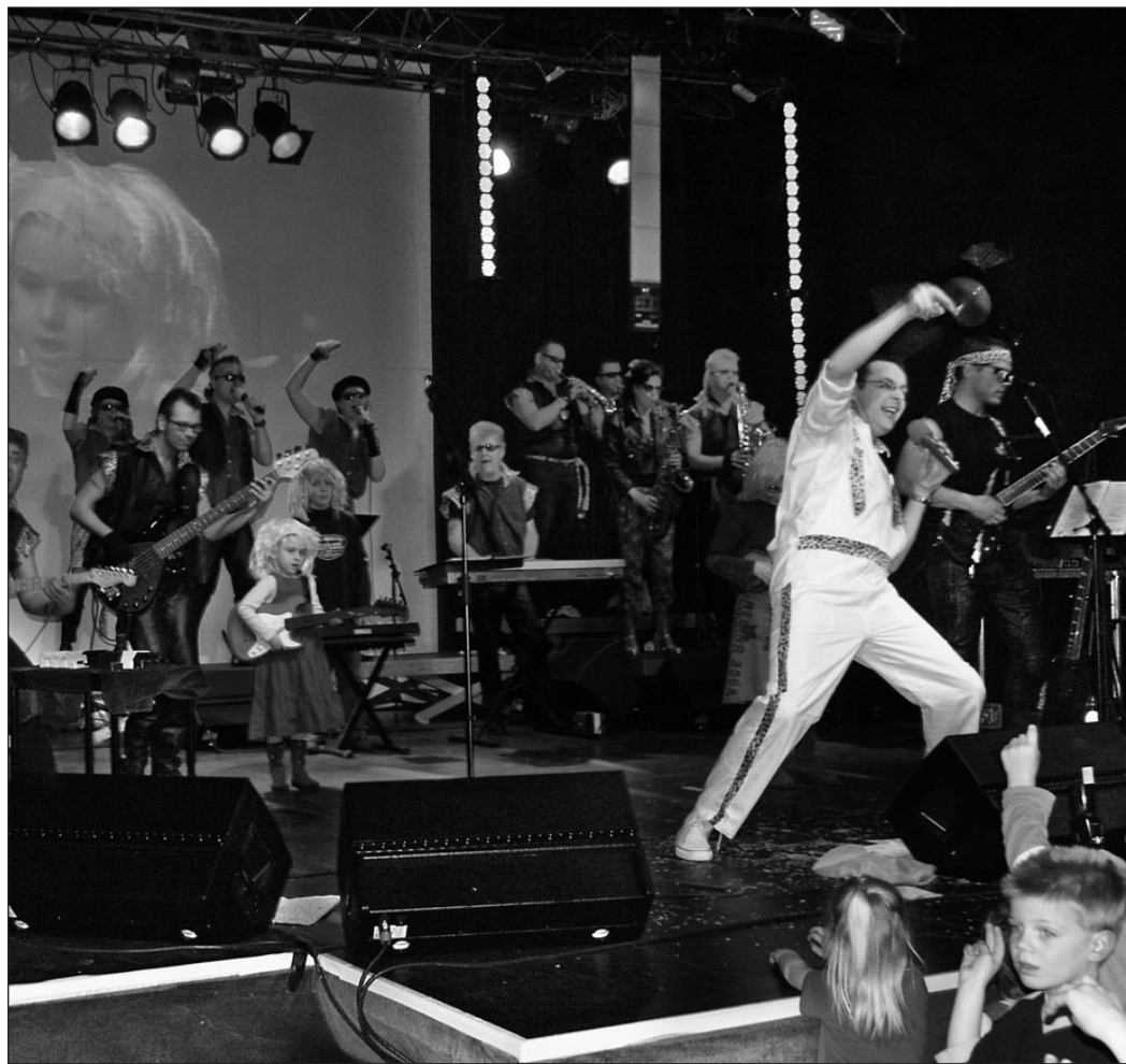
• Een van de eigen producties van 't Pakhuus "Warboel en de Ruige Rockbende": een Nederlandstalige rockshow voor en met kinderen.