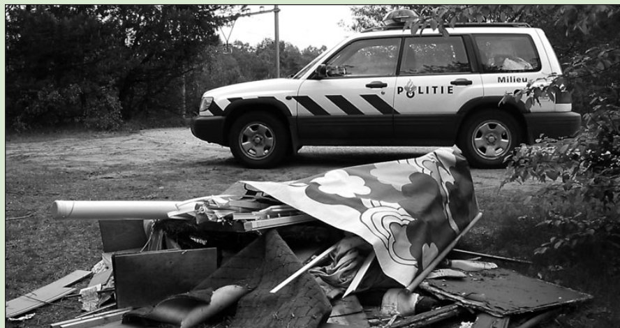
• Makkelijk voor de één, hinder voor de ander.