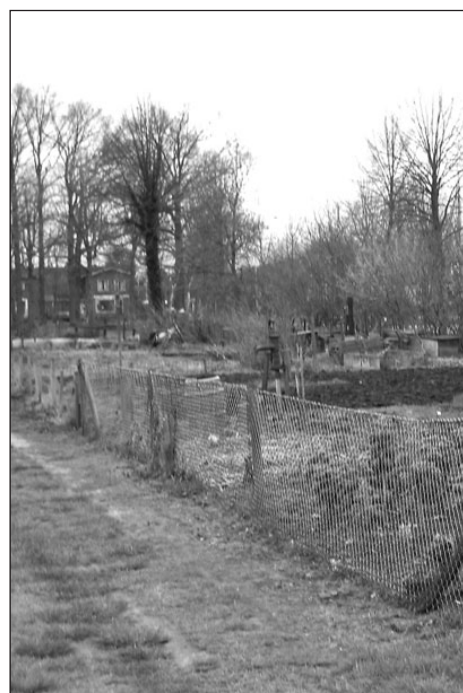
• Het volkstuincomplex aan de Zelheweg in Varsseveld

De gemeente Oude IJsselstreek draagt het volkstuincomplex aan de Zelheweg in Varsseveld over aan de volkstuinvereniging in oprichting. De volkstuinvereniging wil voorkomen dat het complex gesloten wordt en neemt daarom de huur en het beheer van de gemeente over. Het aantal huurders van volkstuintjes aan de Zelheweg neemt af. Daarmee dalen ook de inkomsten voor de gemeente. De gemeente voelt zich echter wel verantwoordelijk voor het onderhoud van de braakliggende tuintjes. De onderhoudskosten en de administratieve kosten wegen niet op tegen de huurinkomsten.