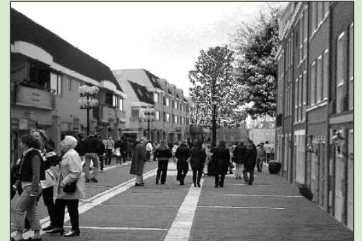
• Mogelijke nieuwe situatie Kerkstraat