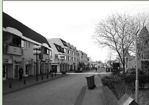
• Bestaande situatie Kerkstraat

Hoe de straten in het centrum er precies gaan uitzien en waar slechts eenrichtingsverkeer zal worden toegestaan en waar tweerichtingsverkeer, dat wordt nog door het college nader uitgewerkt. Alle fracties benadrukken dat ze communicatie met de buurt en andere betrokkenen essentieel vinden voor draagvlak voor de uitwerking.