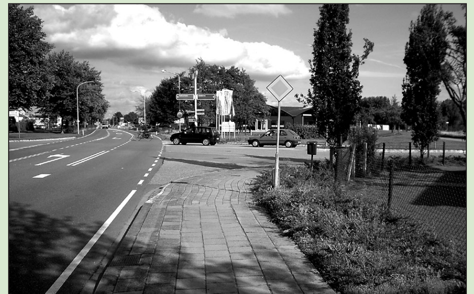
• De rotonde wordt aangelegd op de kruising Aaltenseweg, Sinderenseweg en de Burgemeester van der Zandestraat in Varsseveld