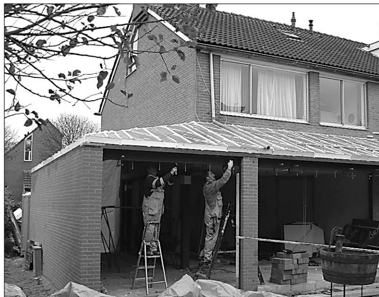
• De gemeente gaat in 2007 onder meer bouwcontroles houden.

Wat zijn ernstige overtredingen en wat valt wel mee? Op televisie lijkt het of de overheid veel mensen bekeurt die fietsen zonder licht maar grote boeven of vervuilers ongemoeid laat. 'Ze', 'de overheid', 'willekeur', 'prioriteiten': menig verjaardagsvisite is er door uitgelopen. Toch is de praktijk minder willekeurig dan het lijkt en heeft de overheid haar prioriteiten keurig genoteerd.