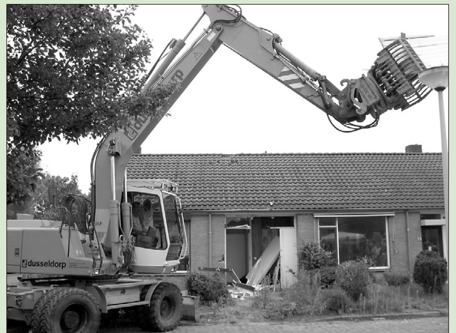
• Meester Ton van de Rietborghschool mocht het eerste huis slopen

Het meest in het oog springende van De Rietborgh leeft! wordt het gebouw van de Brede School. Een multifunctionele accommodatie waarin naast drie basisscholen ook Kinderdagcentrum 't Kempske, Peuterzaal De Ukkepek, een consultatiebureau en een kinderdagopvang onderdak vinden. Bovendien wil de gemeente samen met Fidessa Welzijn de Kulturhusgedachte in dit gebouw vormgeven. Dit houdt in dat de Brede school voor meerdere doeleinden gebruikt kan worden. Het is op de eerste plaats een centrum voor de kinderen van nul tot twaalf jaar oud. Daarnaast krijgt het gebouw de functie van een soort wijkcentrum, waar vergaderingen, bijeenkomsten en voorstellingen kunnen worden gehouden. Ook kan er worden gestopt in de grote gymzaal. Kortom: De Rietborgh wordt een belangrijke plek voor de inwoners van Terborg.