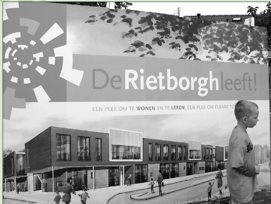
• Het bouwboard van De Rietborgh leeft! werd feestelijk onthuld

De gemeente Oude IJsselstreek en woningcorporatie Wisch Wonen zijn al enig tijd bezig met het project De Rietborgh leeft! Een project om de leefbaarheid van Terborg te bevorderen. Een fijne buurt om te wonen, een prachtige school om in te leren en vooral een plek waar mensen elkaar ontmoeten. Op vrijdag 13 juli ging het project écht van start: op een feestelijke manier werd het startsein gegeven voor de bouw van een nieuwe brede school.