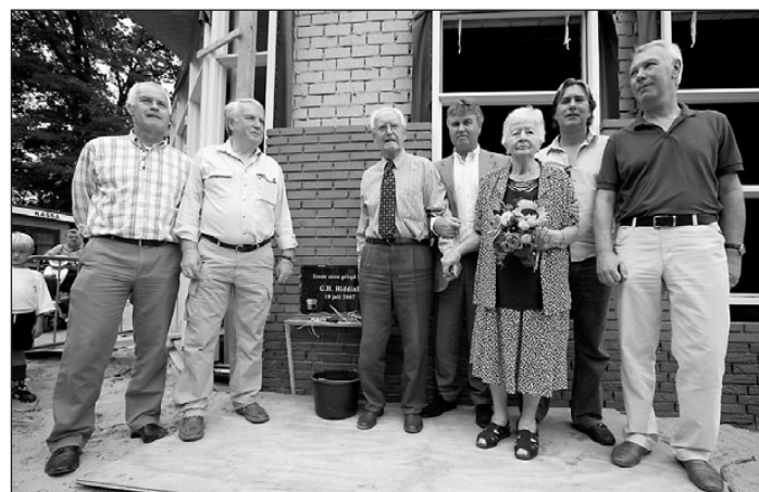
• Vader en moeder Hiddink met vijf van hun zes zonen voor de plaquette van 'eerste steen'

De volledige besluitenlijst van het college van burgemeester en wethouders staat op onze website: www.oude-ijsselstreek.nl . In het menu vindt u onder Bestuur en organisatie de besluitenlijst. U kunt hieraan geen rechten ontfen.