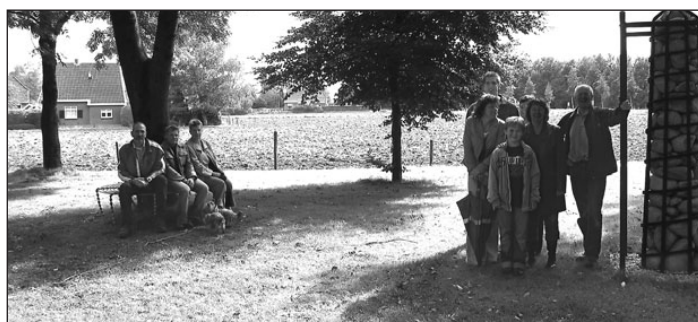
• Bewoners van Bontebrug poseren bij 'hun' kunstwerken. De gemeente is onder andere in deze twee kunstobjecten geïnteresseerd.

Belangenverenigingen en wijkraden uit de gemeente Oude IJsselstreek willen een blijvende herinnering aan de expositie Oer-Kracht. Zij hebben de gemeente daarom gevraagd kunstwerken aan te kopen. De gemeente heeft de belangstelling gepeild en vraagt nu aan de raad om geld beschikbaar te stellen voor de aanschaf van kunstobjecten. De gemeenteraad neemt hier op 25 oktober een besluit over.