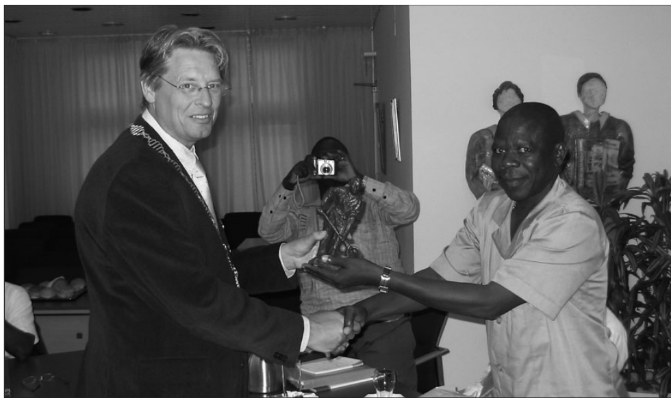
• Burgemeester Alberse overhandigt een beeldje van 'de ijzergieter' aan de burgemeester van Boukombé

Een hoogtepunt was het bezoek aan VMBO de Blumers in Silvolde. De school overhandigde een geldbedrag dat werd ingezameld met de