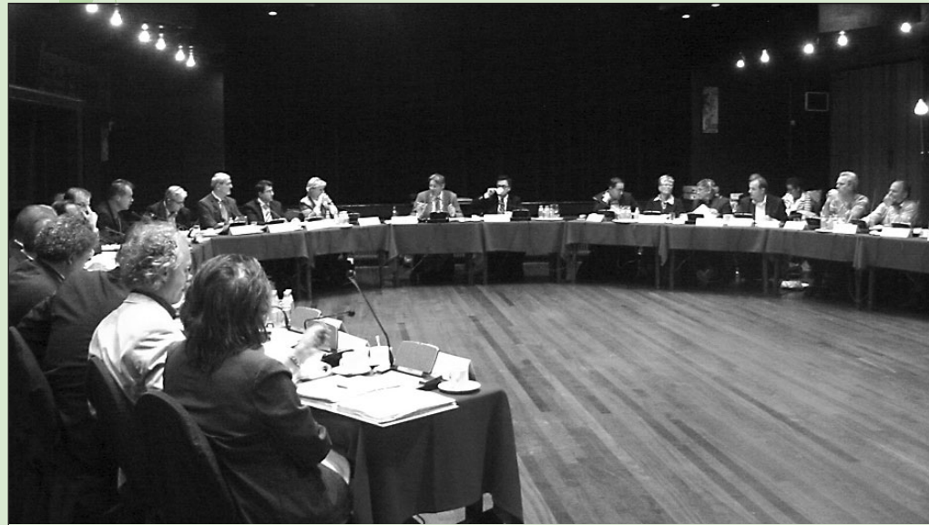
• De gemeenteraad gaat op tour: de eerste vergaderlocatie was zaal De Ploeg in Varsseveld

In zijn vergadering van donderdag 27 september heeft de gemeenteraad besloten om tot het moment dat de conferentiezaal 't Gietelink in Ulf in gebruik wordt genomen de vergaderingen van de gemeenteraad te houden op steeds wisselende locaties in de kernen van onze gemeente. Met ingang van oktober 2007 vinden zo lang als dat mogelijk is de vergaderingen van de drie raadscommissies plaats in het gemeentehuis in Varsseveld. Echter uiterlijk tot het moment dat de conferentiezaal 't Gietelink in gebruik wordt genomen.