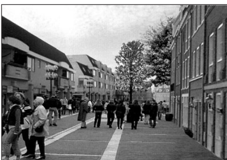
• Ulf straks?