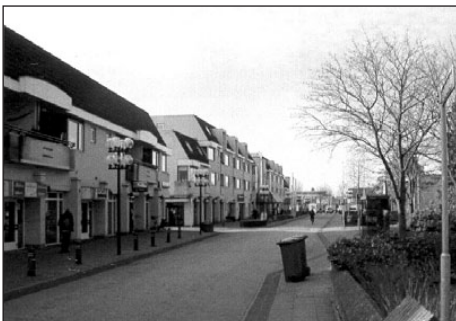
• Ulf nu

Redactie: Heeft u suggesties voor of kritiek op de gemeentepagina's in de Oude IJsselstreeknieuws, meld het de redactie van de gemeentepagina: tel. (0315) 292 292. E-mail: info@oude-ijsselstreek.nl