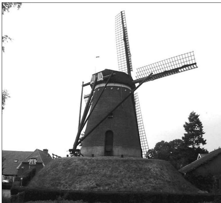
• Molen De Witten in Etten is één van de maalvaardige molens in onze gemeente

In de gemeente Oude IJsselstreek staan op dit moment vier maalvaardige molens. Twee hiervan zijn in eigendom van een stichting en twee zijn in eigendom van de gemeente. Alle vier de molens zijn rijksmonumenten. Voor de financiering van de kosten van instandhouding zijn de molens afhankelijk van rijks- en provinciale subsidieregelingen en sponsorbijdragen van lokale personen/ bedrijven.