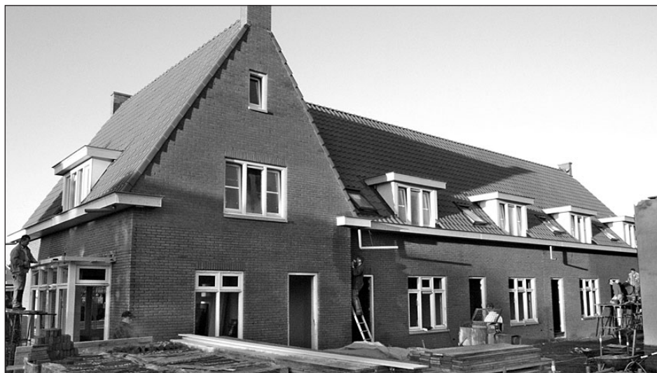
• In twee jaar tijd is het aantal woningen in de gemeente Oude IJsselstreek met 93 gegroeid.

uitgekeken om hier te komen en wil jullie hartelijk bedanken voor jullie inzet en openheid. De gemeente dient hetzelfde belang als de belangenvereniging: werken aan de leefbaarheid in het dorp Netterden. In ieder geval spreek ik de intentie uit om de communicatie tussen Vereniging Leefbaarheid Netterden en de gemeente verder te verbeteren. Daar gaan we in investeren.'