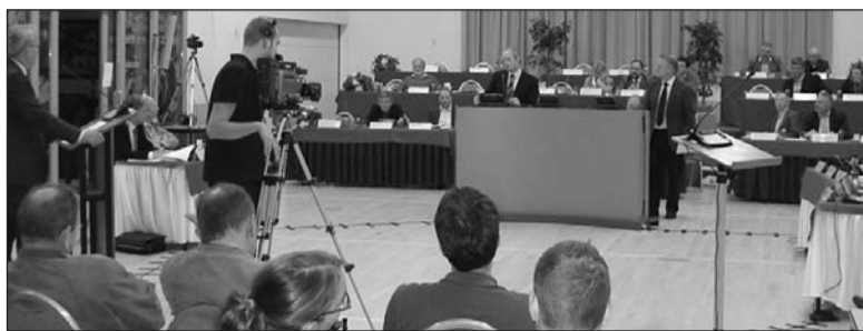
Het oefendebat van de gemeenteraad.

De gemeenteraadsleden van Oude IJsselstreek bezinnen zich op de vraag of het samenspel tussen de gemeenteraad en de samenleving zich verder kan ontwikkelen. Daarvoor heeft de gemeenteraad zich onder andere verdiept in de Smederijen-aanpak van de gemeente Hoogeveen. De "Smederijen" zijn een manier van werken, waarbij dorpen en wijken de nodige invloed hebben op de leefbaarheid, ook financieel.