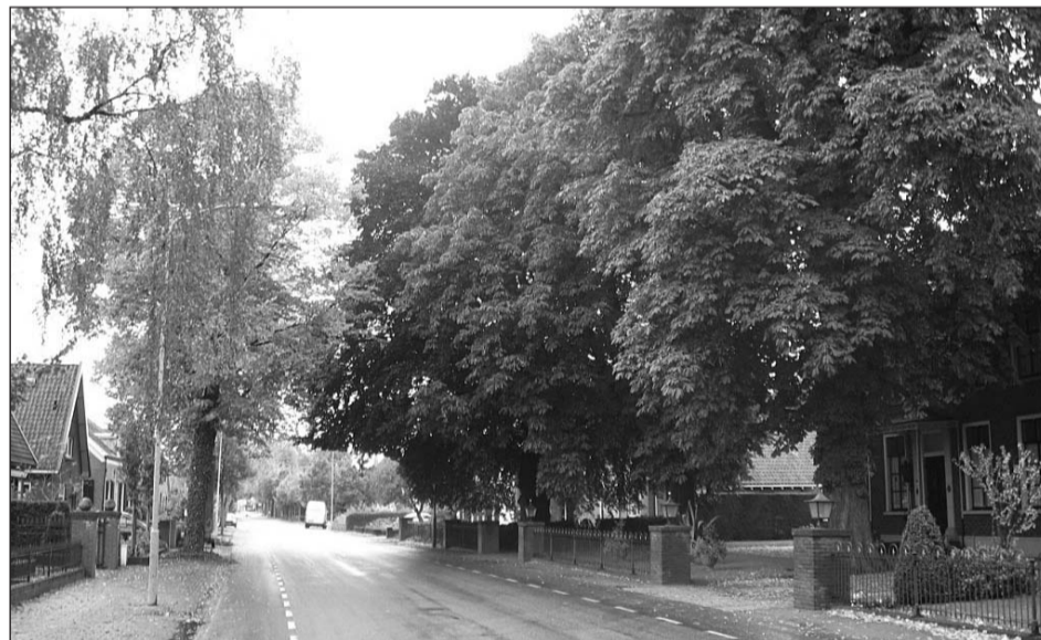
De beuk en kastanjes aan de Anholtseweg in Gendringen zijn voorbeelden van bomen die op de bijzondere bomenlijst staan.

Het college van burgemeester en wethouders van de gemeente Oude IJsselstreek heeft op 7 oktober de lijst met bijzondere bomen vastgesteld. Voor de bomen van particulieren binnen de bebouwde kom op die lijst, blijft een vergunning nodig om te kappen. Voor de bomen die niet voorkomen op de lijst is niet langer een kapvergunning nodig. Doel van de bomenlijst is het aantal aanvragen voor een kapvergunning te verminderen.