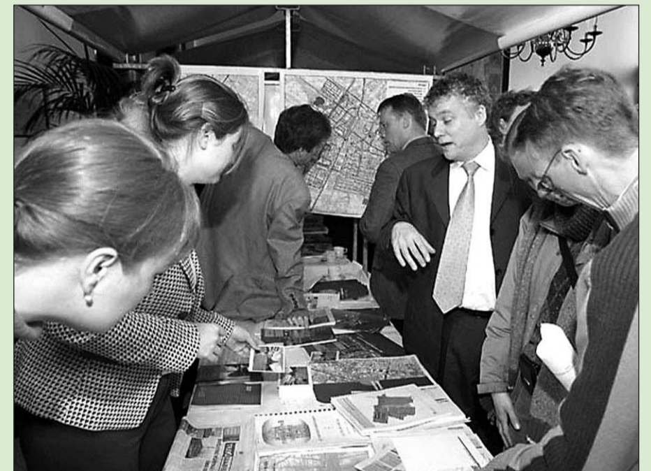
• Een voorstel van het Raadgevend Beraad is het organiseren van een Burgerbraderie: een informele bijeenkomst voor direct contact tussen inwoners en raadsleden.

Wilt u het ontwikkelingsplan van het Raadgevend Beraad zelf lezen? U kunt het aanvragen via griffie@oude-ijsselstreek.nl of bij de griffie via telefoonnummer