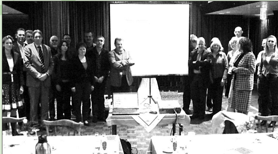
• Het Raadgevend Beraad heeft zich de afgelopen maanden gebogen over het samenspel tussen samenleving, gemeenteraad, college van B&W en ambtenaren