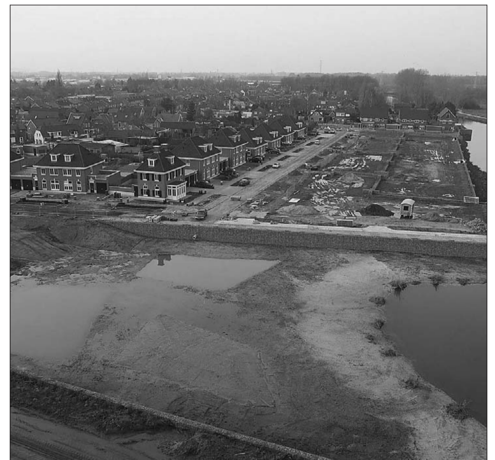
• Vrouwen aan het water in 't Gietelinck

grond. Uitgangspunt is dat de gemeente zeer terughoudend is bij het toekennen van verzoeken voor begraven op eigen grond, dat er veel randvoorwaarden zijn waaraan een dergelijk verzoek moet voldoen en dat het de gemeenteraad is die uiteindelijk bevestigt wanneer er een aanvraag wordt gehonoreerd.