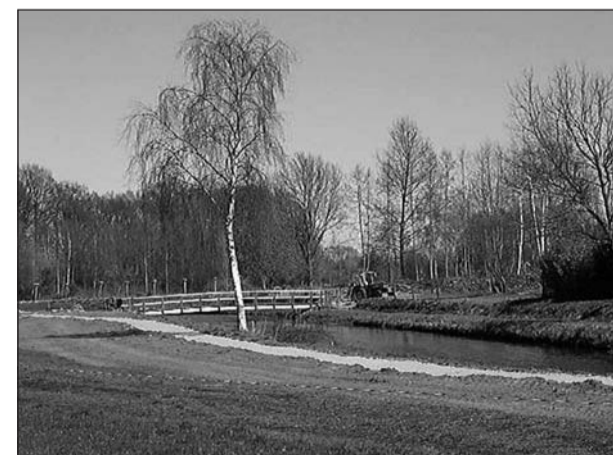
Bruggetje over de Keizersbeek in Sinderen

De gemeenteraad heeft vorige week donderdag in Netterden vergaderd. Tijdens deze vergadering is het Landschapsontwikkelingsplan (LOP) Montferland/ Doetinchem/ Oude IJsselstreek unaniem aangenomen. In het plan staat hoe het landschapsbeleid er de komende jaren uit gaat zien. Het Landschapsontwikkelingsplan is opgesteld samen met de gemeenten Montferland en Doetinchem.