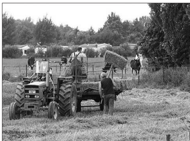
Het LOP houdt rekening met agrariërs (foto's: Jan Besselink)