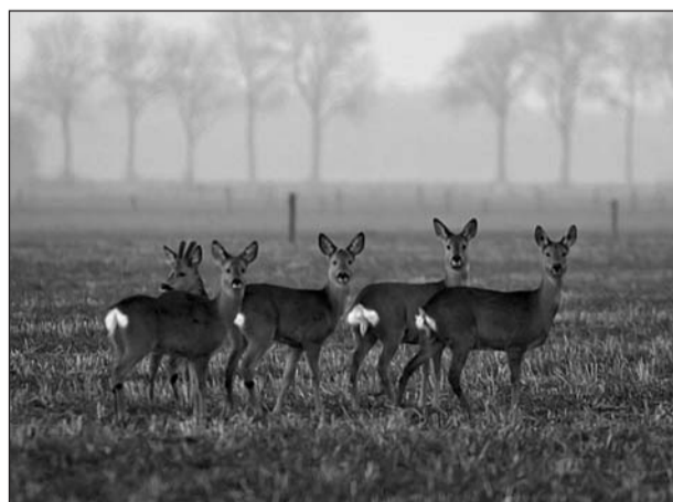
Ook dieren hebben baat bij het LOP