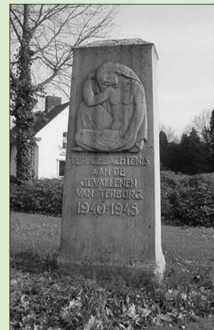
Het oorlogsmonument aan de Silvoldeweg in Terborg

Het wordt op prijs gesteld, als uiting van medeleven, de vlag half stok te hangen tussen 18.00 en 21.00 uur.