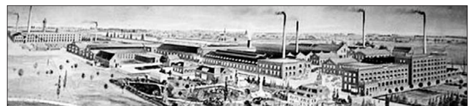
De oorspronkelijke DRU-fabriek

De brochure Modernisering Monumentenzorg (MoMo) is op te vragen bij het ministerie van OC&W.