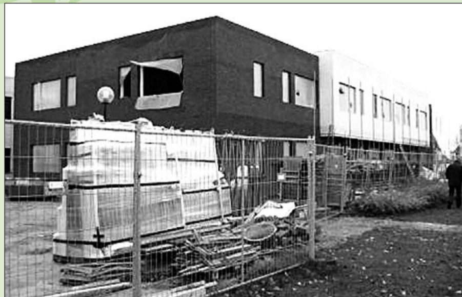
Het gemeentehuis in Gendringen in aanbouw

Sinds vandaag, 2 januari, werken alle medewerkers en bestuurders vanuit het gemeentehuis in Gendringen. Het is de gemeente gelukt binnen 3 jaar na de herindeling één gemeentehuis te realiseren. Ook is vandaag de nieuwe gemeentewerf in Ulf in gebruik genomen. Hier leest u wat beide verhuizingen voor u als inwoner betekenen.