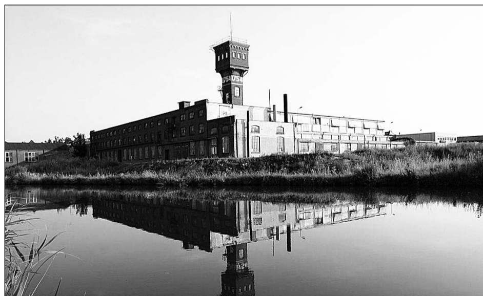
Wethouder Haverdijl over de ontwikkeling van de DRU-fabriek: 'We hebben geen ijzer, maar goud in handen'

Onze kijk op en waardering voor monumentaal erfgoed, historische cultuurlandschappen en monumenten verandert. Minister Plasterk van het ministerie van Onderwijs, Cultuur en Wetenschappen (OC&W) vindt dan ook dat de monumentenzorg moet worden gemoderniseerd. De ontwikkeling van de DRU-fabriek in Ulf ziet het ministerie als een geweldige prestatie en een landelijk voorbeeld van modernisering van de monumentenzorg.