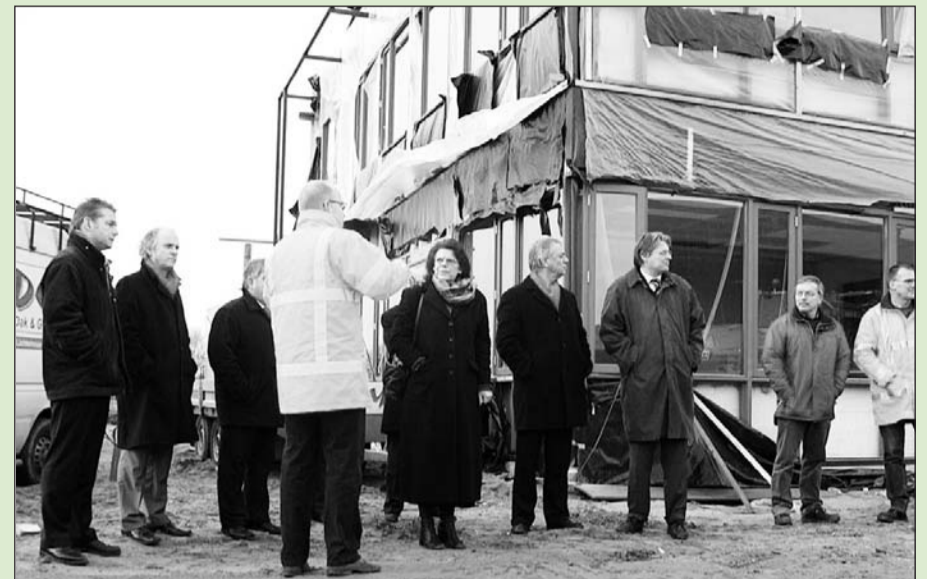
Het college van BenW bezocht begin december de nieuwbouw van de gemeentewerf in Ulf

Het gemeentehuis in Varsseveld is sinds 1 januari verhuurd aan Wonion, een fusie van wooncorporaties Parès en WischWonen. Voor de inwoners van Varsseveld en omgeving is in de bibliotheek in Varsseveld een gemeentelijk informatiepunt ingericht. Dit informatiepunt biedt u de mogelijkheid via een live cameraverbinding mondeling én oogcontact te hebben met een medewerker van het telefoonteam op het gemeentehuis in Gendringen.