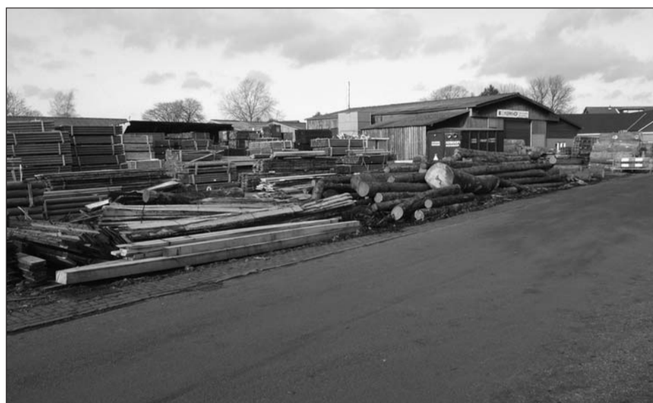
De voormalige houthandel Kerkhof in Westendorp. Hier komen 22 woningen.

Donderdag 29 mei vergaderde de gemeenteraad in het Buurtschapshuis in Sinderen. De raad sprak onder andere over de jaarrekening 2007, een subsidie voor de Stichting Stadsherstel Terborg en het ontwerpbestemmingsplan voor het terrein van de voormalige houthandel Kerkhof in Westendorp.