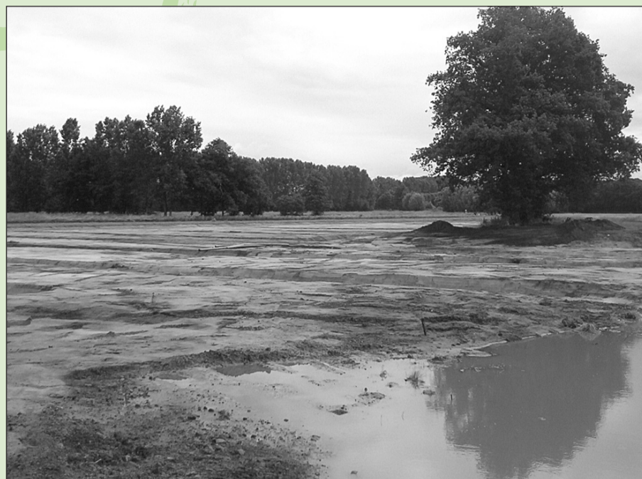
Het retentiegebied in ontwikkeling: het regenwater kan al verwerkt worden en de natuur is welkom.

Aan de Oostzijde van Varsseveld wordt hard gewerkt aan de ontwikkeling van het nieuwe bedrijventerrein Hofskamp Oost 2. Onder de nieuw aangelegde wegen is een rioolsysteem aanwezig dat moet zorgen voor de afvoer van het vuile water. Voor de afvoer van (schoon) regenwater is gekozen voor een meer gebiedseigen benadering.