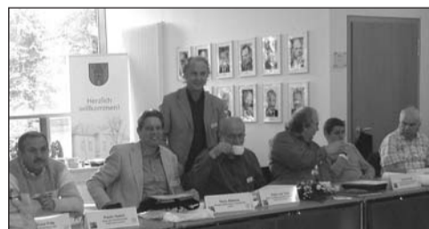
Een delegatie van de Ring van Europese IJzersteden.

ten van een reizende 'damasttentoonstelling'. Damaststaal is een bijzonder soort smeedstaal voor bijvoorbeeld messen, maar ook voor sieraden met schitterende opper-