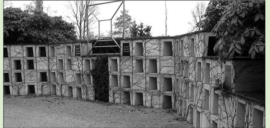
De urnenmuur op begraafplaats Rentinkkamp