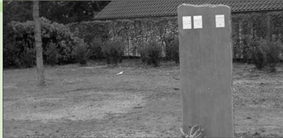
Het gedenkmonument op het vernieuwde en uitgebreide strooiveld.

De afgelopen vijf jaar is de gemeente bezig geweest met de renovatie van begraafplaats Rentinkkamp in Varsseveld. Ook is het strooiveld uitgebreid en meer geïntegreerd in de omgeving van de begraafplaats.