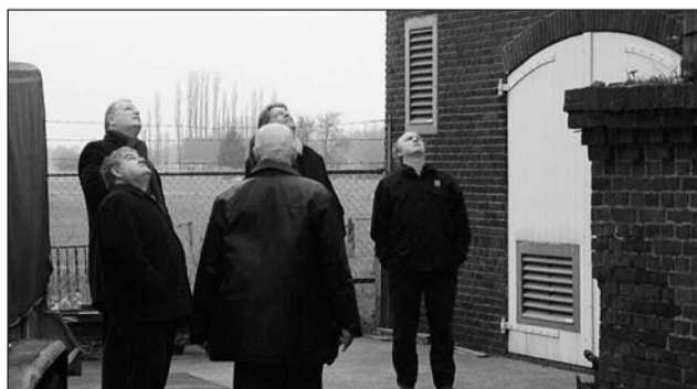
Gendringen Hout Groep bekleedt een hoge positie op de markt van de houtdrogerij.