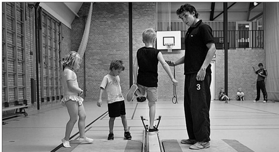
Twee keer per jaar ondergaan de leerlingen een B-Fit test om hun fitheid te meten.

De gemeente en de Gelderse Sport Federatie vinden het tijd om overgewicht bij kinderen zoveel mogelijk te voorkomen. Daarom start binnenkort het actieprogramma tegen overgewicht B-Fit op vijf basisscholen in de gemeente. Gedurende twee jaar zal een B-Fit consultant van de Gelderse Sport Federatie, daadwerkelijk op de scholen aanwezig zijn om de schoolleiding te begeleiden bij het tegengaan van overgewicht.