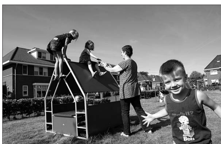
• Leefbaarheid in de kernen blijft een belangrijk speerpunt

Met dit programma wordt het gebied Etten-Terborg-Silvolde-Ulft-Gendringen bedoeld. In dit gebied wordt de unieke combinatie van landelijk wonen met stedelijke voorzieningen benut. De projecten in dit programma zijn te onderscheiden in voorzieningen, centrumplannen en wijkverbeteringen. Deze projecten maken onderdeel uit van het projectplan "Op weg naar 2020". Een belangrijke pijler van dit programma is de participatie van iedereen aan de maatschappij. Een volwaardige plek in de samenleving is daarbij het uitgangspunt.