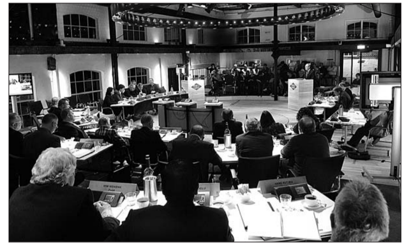
• De gemeenteraad stelde voor het eerst de begroting vast in de nieuwe raadzaal

Bij aanvang van de begrotingsraad verzochten insprekers van sport- en cultuurverenigingen om hun plan niet door te schuiven naar 2011, maar