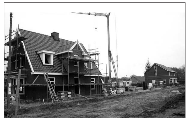
• Woningbouw aan De Houtwerf in Westendorp

De vraag bij dit programma is hoe de gemeente haar inwoners op maat van dienst kan zijn. Digitaal waar mogelijk, maar ook persoonlijk waar gewenst. In tijden dat de financiën onder druk staan is de noodzaak om goed naar alle activiteiten van de gemeente te kijken het grootst. Doen we als gemeente de juiste dingen en hebben we dit op een efficiënte en