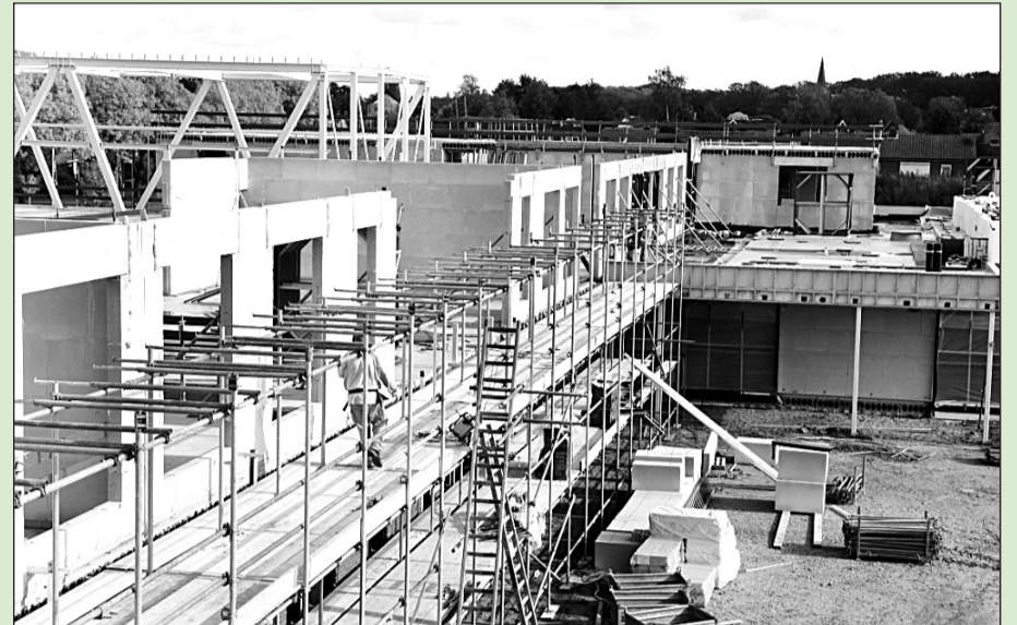
• Volgens planning wordt de Rietborgh in mei 2010 opgeleverd

Het Vezo-terrein is al vele jaren een doorn in het oog van de gemeente en de inwoners van Terborg. Na de sluiting van de Vezo supermarkt is het terrein verpauperd. Voor de locatie zijn de afgelopen jaren diverse bouwplannen ontwikkeld, die telkens niet tot uit-