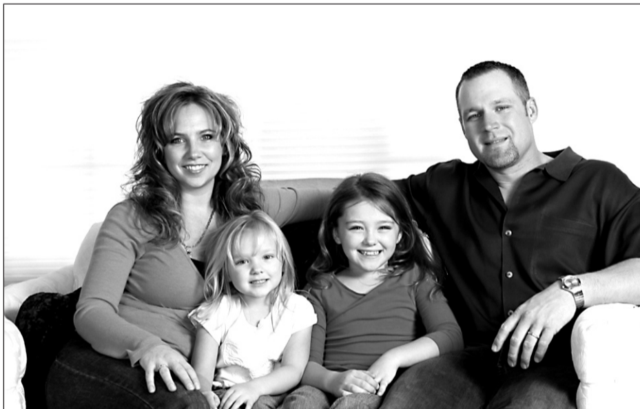
• Het centrum voor Jeugd en Gezin helpt bij allerlei vragen over opvoeden en opgroeien

Op 1 april wordt het Centrum voor Jeugd en Gezin (CJG) geopend in de gemeente Oude IJsselstreek. Daarmee is Oude IJsselstreek de eerste Achterhoekse gemeente waar ouders, kinderen en jongeren met al hun vragen over opvoeden en opgroeien in één centrum terecht kunnen. Niet alleen bij grote problemen biedt het CJG een helpende hand maar ook bij kleine alledaagse vragen. U kunt en hoeft namelijk niet voor alles zelf een oplossing te weten.