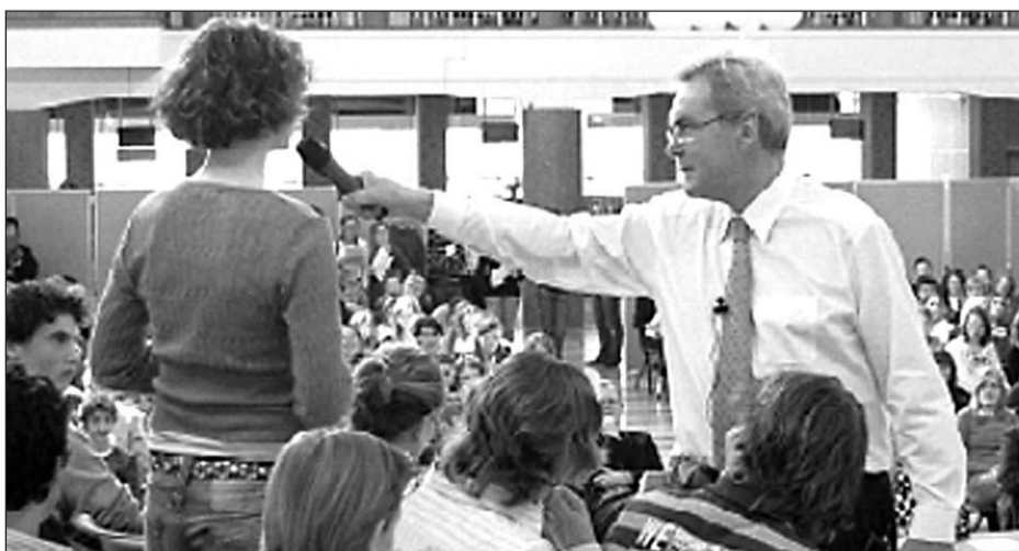
• Andere gemeenten hebben al een scholierendebat, zoals op deze foto in Hengelo(O)