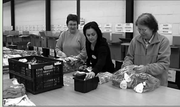
• Een medewerker van de gemeente (midden) helpt een handje bij de Moeder Teresa Stichting