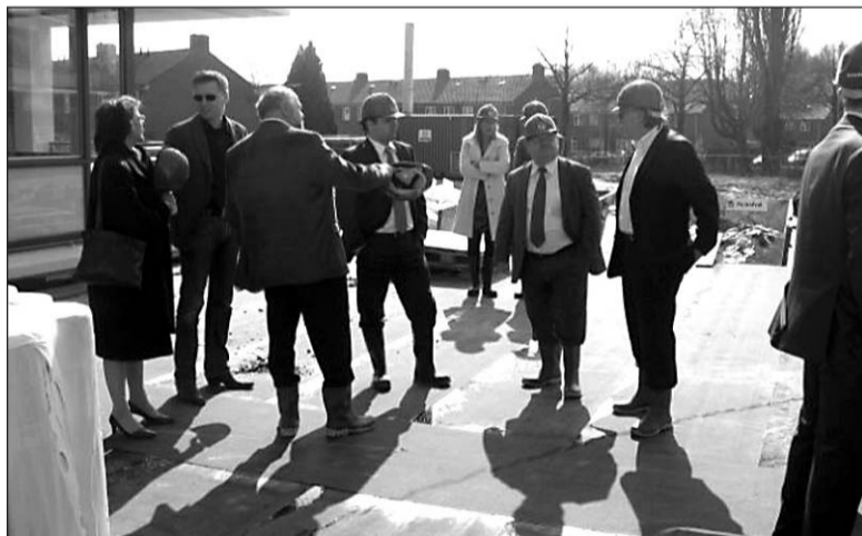
• De delegatie op bezoek bij project "Het Podium" in Arnhem dat een voorbeeld is van een herstructureringswijk

Al met al een zeer geslaagde en informatieve middag waarbij de aanwezigen op een prettige manier met elkaar ervaringen hebben uitgewisseld.