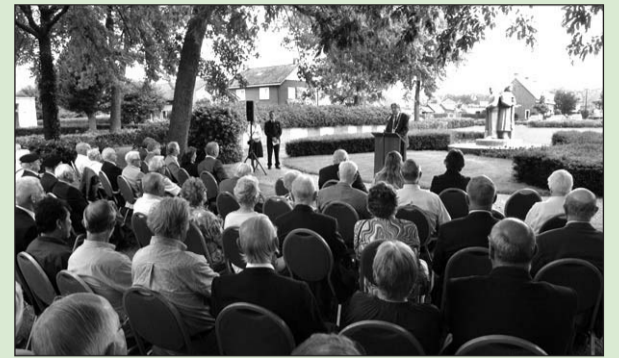
• De korte ceremonie aan de Pr. Irenestraat