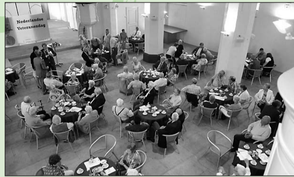
• De ontvangst in de Laurentiuskerk in Varsseveld