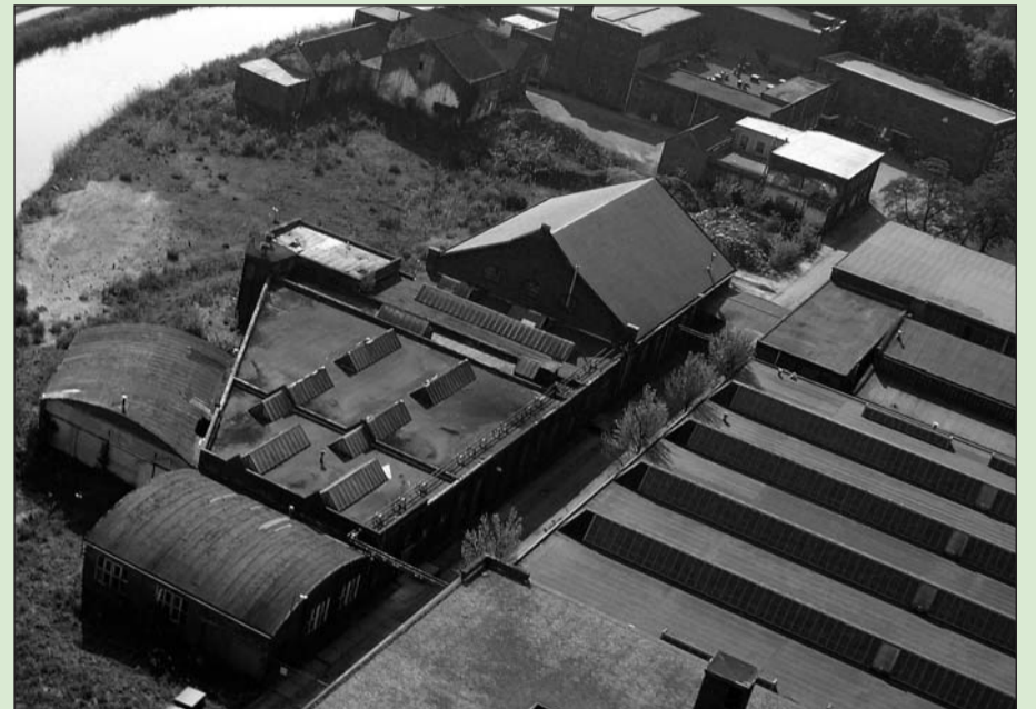
• Nog een paar nachtjes en de skatehal (gebouw met puntdak) gaat weer open

Omdat de bouw- en saneringswerkzaamheden doordeweeks gewoon doorgaan, is de skatehal alleen in het weekend geopend. De skatehal is vanaf 10 januari 2009 op