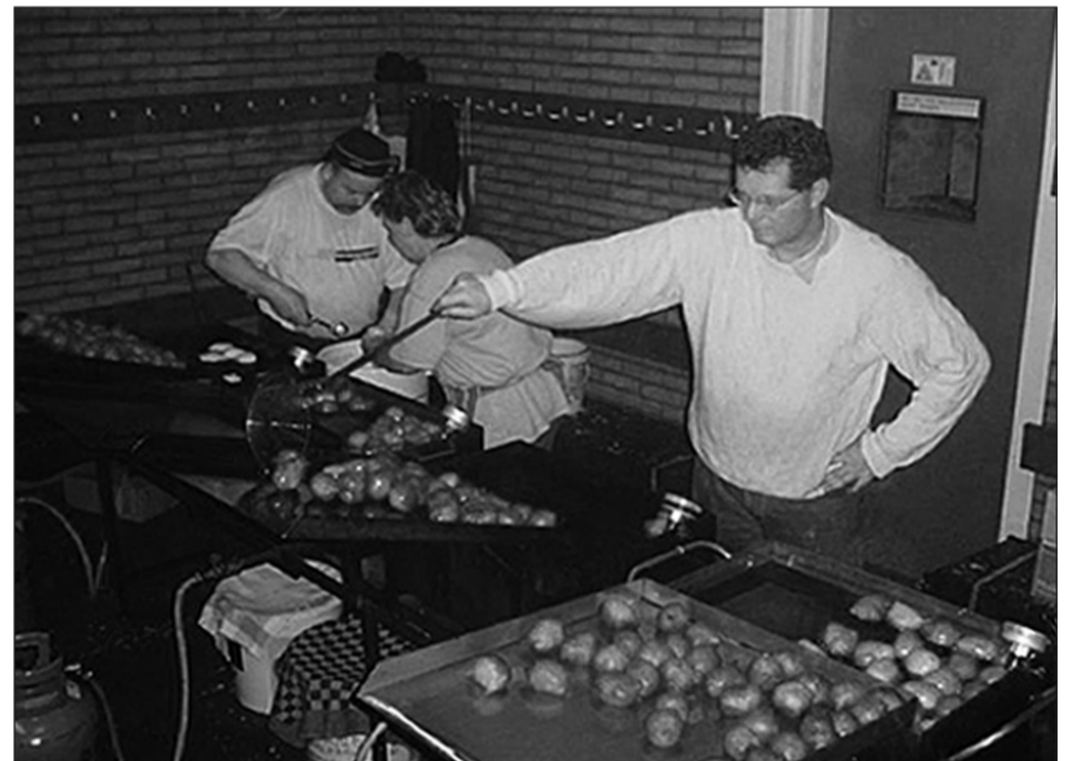
• Ook verenigingen mogen zonder vergunning venten

Verder wordt het mogelijk zonder vergunning tijdelijk een puincontainer op de weg te plaatsen voor een verbouwing, mits dit niet ten koste gaat van de veiligheid. Verder is er geen vergunning meer vereist voor venten. Commerciële ondernemers mogen venten tussen 09.00 uur en 18.00 uur. Voor bepaalde stichtingen en verenigingen is tot een ruimere regeling besloten (tussen 09.00 uur en 22.00 uur), omdat zij vaak afhankelijk zijn van vrijwilligers die overdag werken.