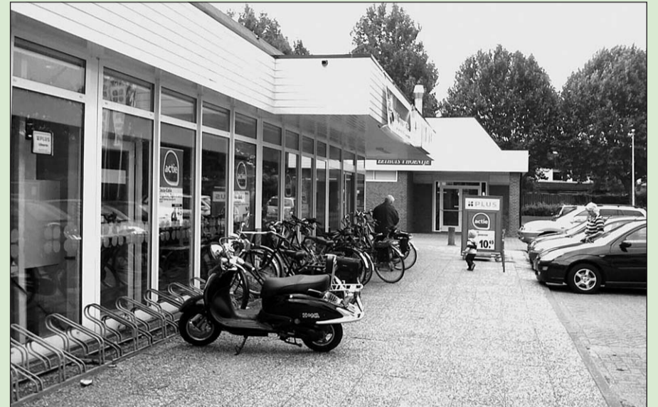
• De inwoners van Silvolde-Oost kunnen laten weten wat zij vinden dat er in hun wijk moet gebeuren

Inwoners kunnen hun ideeën opgeven bij Wonion, die samen met Fidessa Welzijn de vragen inventariseert en dan de route uitzet die op 31 oktober wordt gefietst, met veel stops voor een praatje met de bewoners. Inwoners van Silvolde-Oost krijgen binnenkort een brief van Wonion, Fidessa Welzijn, de politie en de gemeente. Bij de brief zit een antwoordformulier waarop men wensen en problemen kan noteren. De medewerkers van de organisaties die met de wijk rondgang meegaan kunnen vragen en ideeën ter plekke bespreken.