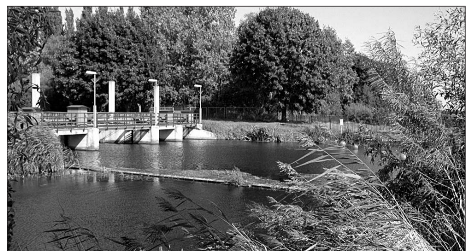
• De natuurontwikkeling aan de Oude IJssel. Dit is het uitzicht vanuit de woningen van deelplan 4.

Deelplan 4 is het meest noordelijke plandeel van het project Hutten-Zuid. Het driehoekige terrein ligt ingeklemd tussen de Bongersstraat aan de westzijde en de Oude IJssel aan de oostzijde. Zuidelijk grenst het gebied aan een groene scheg. Dit deelplan bestaat uit een woongebouw, een verzonken parkeervoorziening en een openbare ruimte met een publieke functie.