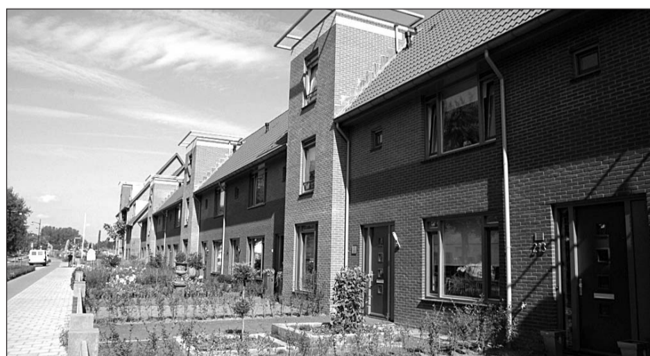
• De woningen van deelplan 1. In deze sfeer worden ook de woningen van deelplan 4 gerealiseerd.

Het ontwerpbestemmingsplan en beeldkwaliteitplan voor Hutten-Zuid – Deelplan 4 hebben zes weken ter inzage gelegen. In deze zes weken zijn geen zienswijzen ingediend op de plannen. Het college van B&W vraagt de gemeenteraad in de raadsvergadering van 24 september het bestemmingsplan en beeldkwaliteitplan ongewijzigd vast te stellen. Het bestemmingsplan is opgesteld om de bouw van een appartementencomplex met bijbehorende voorzieningen en de aanleg van een ecologische verbindingzone (verbindt natuurlijke gebieden met elkaar) mogelijk te maken. Het beeldkwaliteitplan is er om bouwinitiatieven te kunnen toetsen en de beoogde ruimtelijke kwaliteit te halen.