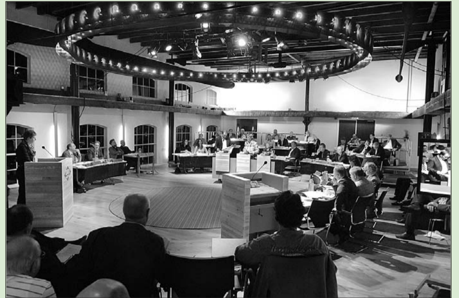
• De gemeenteraad in de nieuwe vergaderopstelling.

De permanente bewoning van recreatiewoningen is al jaren onderwerp van discussie. Het gaat met name om de woningen op recreatiepark t Isselt in Ulft. De gemeenteraad moest donderdag een keuze maken uit drie alternatieven. Onder grote publieke belangstelling gingen de partijen ruim anderhalf uur met elkaar in debat over dit onderwerp. Lokaal Belang en de VVD spraken zich uit voor legalisering (wel onder voorwaarden) van permanente bewoning. Hiermee krijgen recreatiewoningen een woonbestemming. t Isselt zou dan een normale woonwijk worden. De meerderheid van de gemeenteraad, CDA en PvdA, koos echter voor een persoonsgebonden ontheffing. Dat houdt in dat alle bewoners die sinds 31 oktober 2003 onafgebroken hebben gewoond in een recreatiewoning er mogen blijven wonen. De woningen houden wel een recreatieve bestemming. Wanneer een huidige bewoner verhuist of overlijdt,