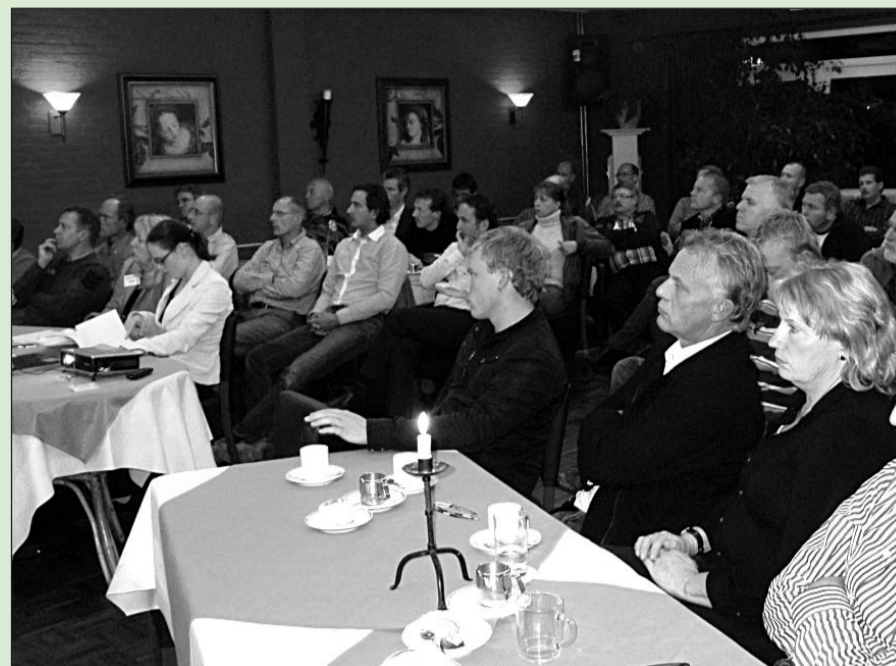
• Tijdens het eerste deel van de avond werd iedereen bijgepraat.

Na afloop van beide presentaties was er volop ruimte voor het stellen van vragen. En deze waren er zeker; zowel algemene vragen die voor iedereen van belang waren als ook hele specifieke, individuele vragen die door de gemeente in een persoonlijk gesprek werden beantwoord.