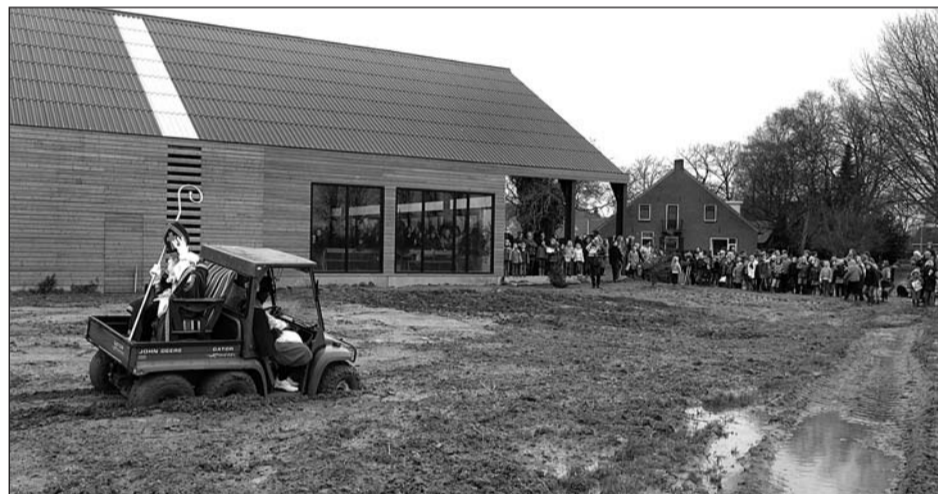
• Sinterklaas gestrand in de modder bij Diekshuus