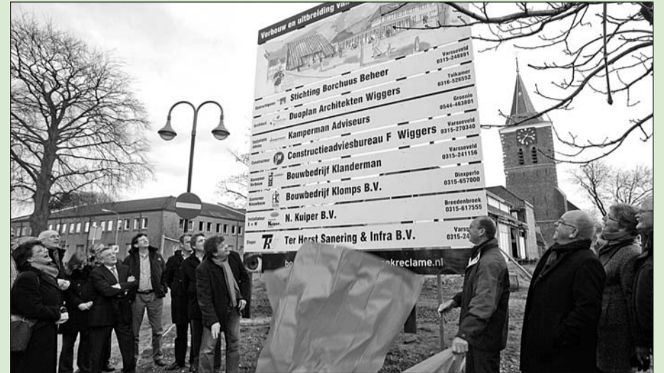
• Met de start van de bouw van het Borchuus krijgt het Centrumplan Varsseveld een nieuwe impuls.

Het Borchuus wordt gerealiseerd op de locatie waar voorheen pand Weenink gevestigd was. Pand Weenink is gesloopt en heeft plaats gemaakt voor een groter Kerkplein. Op dit plein wordt een glazen ontmoetingsruimte gerealiseerd, de zogeheten