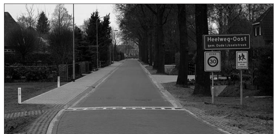
• Minder kans op snelheidsovertredingen in Heelweg-Oost

Alles bij elkaar reden genoeg voor de gemeente om op vrijdag 11 december om half acht 's avonds de wegen op een feestelijke wijze in gebruik te nemen.