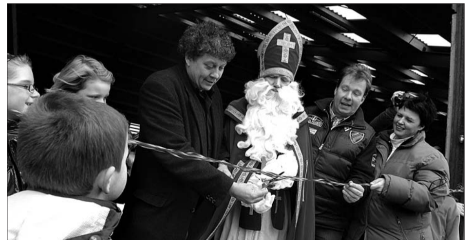
• De binnenrijhal is een belangrijke aanwinst voor het paardensportcentrum

De overdekte rijhal van Diekshuus is een belangrijke aanwinst voor het paardensportcentrum. Het paardensportcentrum was nog niet in bezit van een rijhal, waardoor er altijd