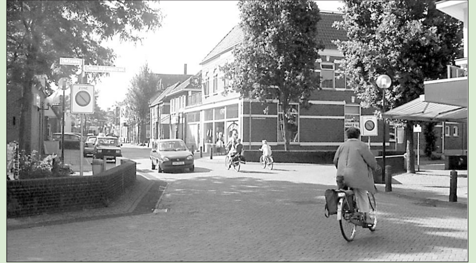
• De raad ging akkoord met het verkeerscirculatieplan Ulfthuis

De gemeenteraad heeft unaniem ingestemd met de kaderstelling voorzieningen. Doel van de opgestelde kaders is te komen tot het gewenste voorzieningenniveau in de gemeente, zodat we kunnen spreken van een leefbare en vitale plattelandsgemeente. Het gaat hier om voorzieningen op het gebied van onder andere gezondheid, onderwijs, cultuur (bibliotheek, muziekschool, theater etcetera) en sport en recreatie (sportvelden en sportzalen, zwembaden, speelplaatsen). Deze kaders worden gebruikt als leidraad voor het accommodatiebeleid en het leefbaarheidsbeleid. Alle vier partijen benadrukten tijdens de vergadering het belang van voldoende en kwalitatief goede voorzieningen. De PvdA vroeg aandacht voor de betaalbaarheid en bereikbaarheid van voorzieningen. De VVD benadrukte dat bij de uitvoering van de kaders maatwerk noodzakelijk is. Het CDA sloot hierbij aan en vroeg om een kerngerichte aanpak.