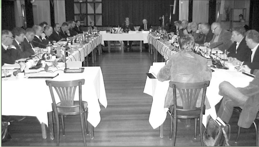
• De raad vergaderde vorige week donderdag in zaal Koenders in Breedenbroek