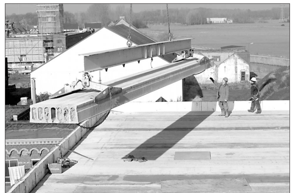
• Het dak van de theaterzaal bestaat uit 16 meter lange betonnen dakplaten. Met een grote telescoop hijskraan werden deze afgelopen vrijdag geplaatst

De gelijkvloerse theaterzaal heeft een oppervlakte van 525 vierkante meter en biedt plek aan 350 personen. Bijzonder is dat het theater binnen de muren van het voormalige Portiersgebouw wordt gebouwd; er staat als het ware een gebouw binnen een gebouw.