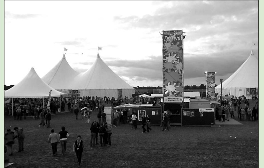
• Een blik op het voormalige Huntenpop festival aan de Berghseweg tussen Varsselder en Veldhunen.