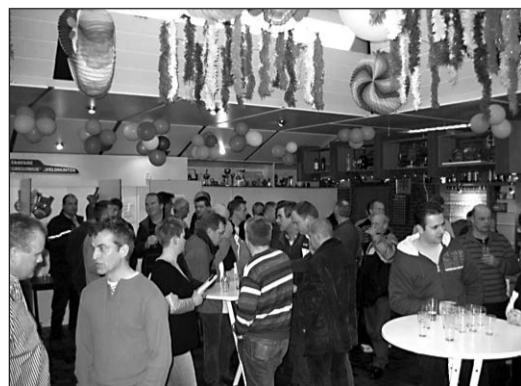
• Leden van de voetbalvereniging en het gilde wachten de uitslag in spanning af