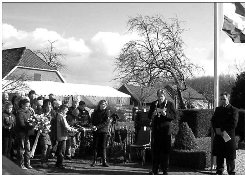
• Er waren veel belangstellenden bij de herdenking van vorig jaar

Op maandag 2 maart om 12.00 uur wordt de executie van 46 Nederlanders in een tarweveld aan de Rademakersbroek bij Varsseveld van 2 maart 1945 herdacht. Een vertegenwoordiging van het gemeentebestuur van de gemeente Oude IJsselstreek en leerlingen van de Prinses Julianaschool uit Heelweg verzorgen in een sobere bijeenkomst de herdenking bij het monument Rademakersbroek. U bent vanaf 11.30 uur van harte welkom in de tent aan de Aaltenseweg 92.