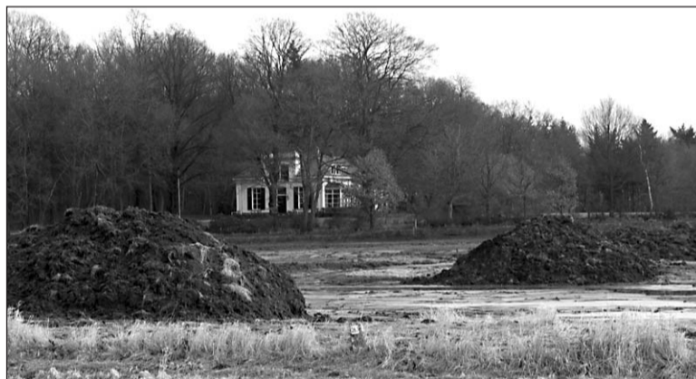
• De werkzaamheden bij Landgoed van Bon

Woensdag 25 februari wordt het officiële startsein gegeven voor de restauratie van Korenmolen Voorst. Niet alleen de buitenkant wordt opgeknapt, maar de molen krijgt ook zijn wieken en dus zijn maalfunctie terug.