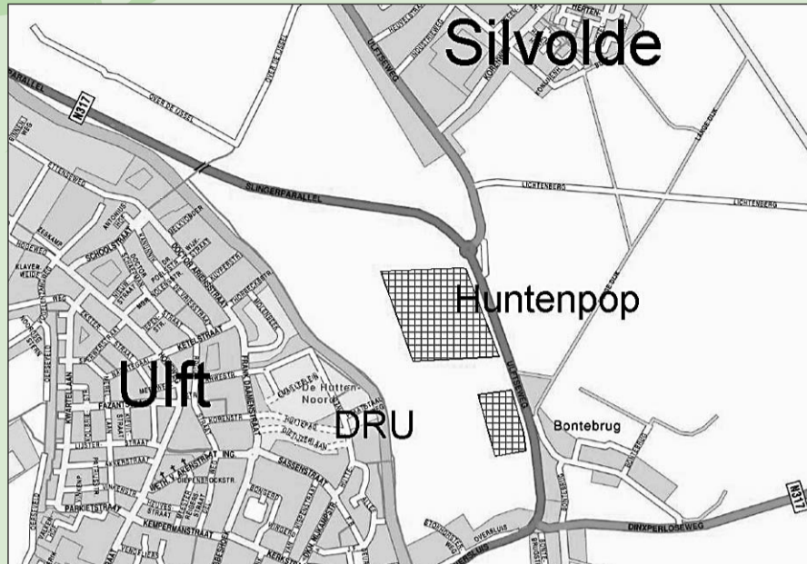
• Een schematische weergave van de nieuwe locatie tussen Ulf en Silvolde

Deze maand is bekend gemaakt dat Huntenpop verhuist. Op 28 en 29 augustus slaat het festival haar tenten op aan de Ulfseweg in Silvolde. De twintigste editie van het festival, dat sinds de eerste editie altijd in Varsselder-Veldhunen plaatsvond, heeft nu een kans om te blijven bestaan en om door te groeien. De nieuwe locatie met de historische DRU fabriek en de Oude IJssel op steenworp afstand biedt veel kansen.