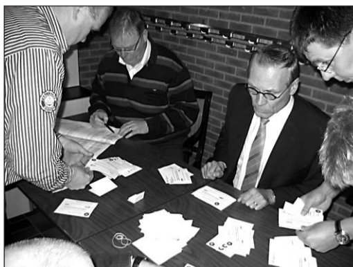
• Onder toezien oog van notaris Hofstad worden de stemmen geteld