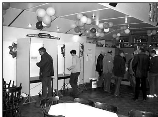
• De stemming gaat geheel officieel met stemhokjes en een stembus