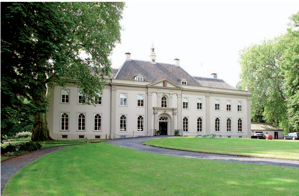
Op Open Monumentendag zijn de tuinen van Huis Landfort in Megchelen te bezichtigen.

Huis Landfort in Megchelen weer te bezoeken. De tuinen worden momenteel gerestaureerd naar het oorspronkelijke ontwerp van Jan David Zocher uit 1823. Er worden rondleidingen gegeven door mensen van het IVN (Instituut voor Natuureducatie). Gidsen van het IVN zijn ook op andere plekken actief, of hebben voor de nodige natuurhistorische informatie ter plaatse gezorgd.