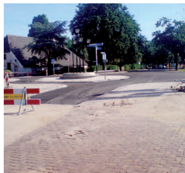
De werkzaamheden aan de kruising Anholtseweg – Grotestraat – Oranjesingel zijn inmiddels afgerond

De reconstructie van de Anholtseweg in Gendringen is in volle gang. De kruising Anholtseweg – Grotestraat is op 16 juli 2010 weer opengesteld voor het verkeer. Alleen de bovenste laag asfalt moet nog worden aangebracht. Ook de bodemsanering op de hoek van de Anholtseweg - Julianastraat is afgerond. Wat gaat er het komende half jaar gebeuren?