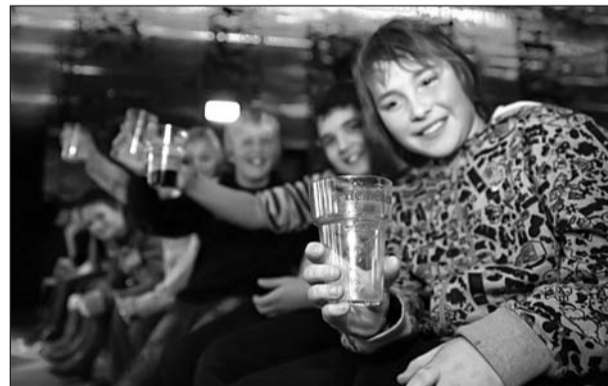
• Het glas doet anders vermoeden; jongeren drinken frisdrank.