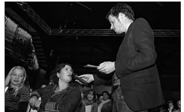
• Het publiek dacht en praatte mee, zoals deze moeder.

Vrijdagavond 29 januari liep de popzaal van de Drufabriek langzaam vol met jongeren, sommigen hadden hun ouders meegebracht anderen waren met vrienden. Ook jongerenwerkers, sportbegeleiders en docenten waren aanwezig. Allen kwamen voor de avond over Alcohol en jeugd, voor de band Kiek Now Us en natuurlijk voor presentator Filemon Wesselink.