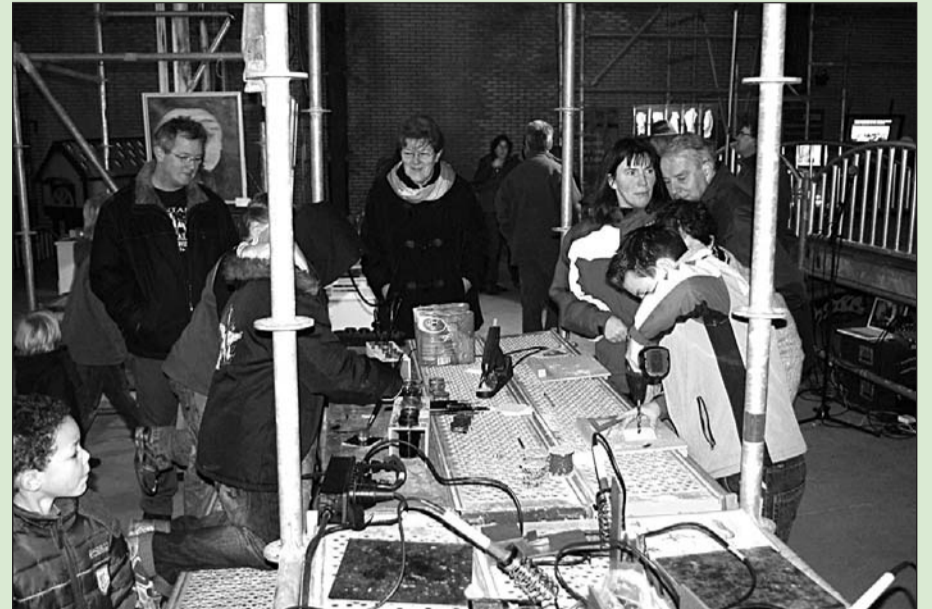
• Jong en oud kon tijdens de open dag in december 2008 voor het eerst kennis maken met de plannen om de techniek terug te brengen naar de Afbramerij

Over de financiële onderbouwing van het plan voor de Afbramerij waren de meningen verdeeld. Om het Sciencecentrum in de Afbramerij te realiseren is bijna acht miljoen euro nodig. 5,5 miljoen euro moet van externe partijen komen. De gemeenteraad wilde nog niet het resterende bedrag van 2,4 miljoen beschikbaar stellen, zoals het college had gevraagd. Jan Finkenflugel van Lokaal Belang vond de financiële onderbouwing een gevoelig punt, en diende mede namens de coalitiegenoten PvdA en VVD een amendement in over de financiën. 'Risico's moeten we zoveel mogelijk beperken', aldus Jos Sluiter van de VVD. Maar de drie partijen vonden het belangrijk om nu wel door te pakken: 'Het is een prachtig, ambitieus plan. De overheid moet het voortouw nemen om plannen uit te voeren in tijden van crisis', aldus Bennie Siemes van de PvdA. De coalitie stelde daarom voor nu twee ton beschikbaar te stellen om te onderzoeken of er voldoende externe financiers zijn om de 5,5 miljoen euro te dekken. De resterende