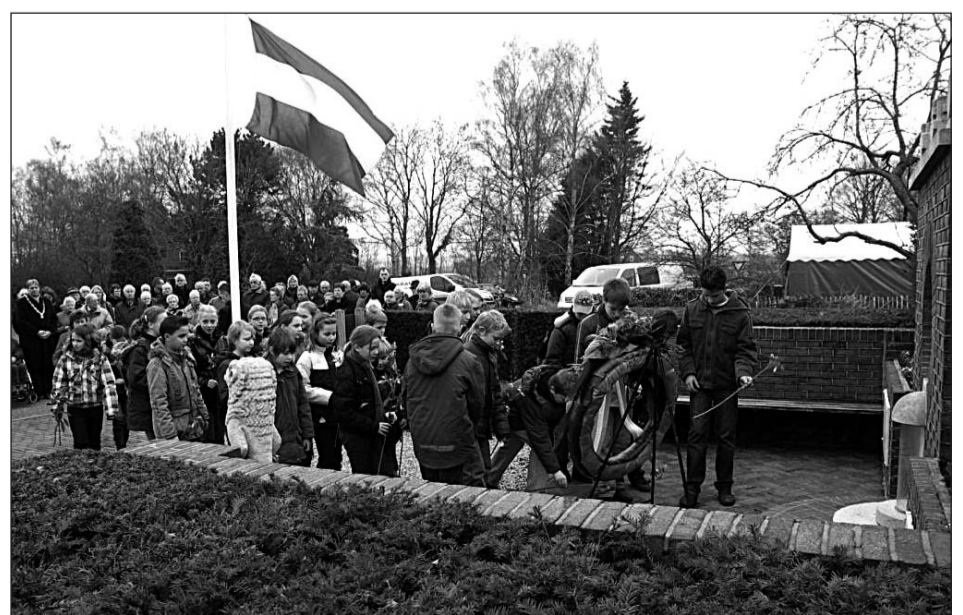
• Ook vorig jaar verzorgden leerlingen van de Prinses Julianaschool mede de plechtigheid.

In 1949 is het monument opgericht ter nagedachtenis aan de slachtoffers van de executie. In het monument is een rozet gemetseld met een gedicht van Garnt Stuiveling.