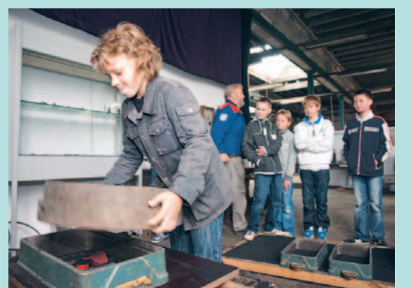
Nast zelf smeden mogen de kinderen helpen bij het maken van gietvormen.