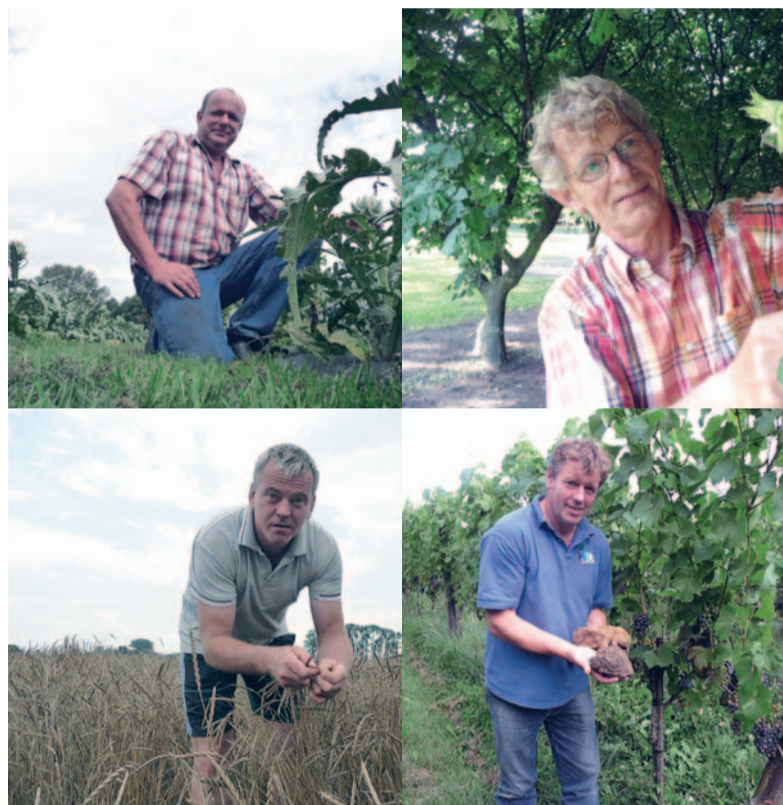
Op de IJzer = Lekker markt laten kwekers u proeven van onder meer: artisjokken, speltproducten, hazelnoten en rode wijn. Bijzonder zijn ook de boeketten van eetbare bloemen en bessen.

Dat spinazie veel ijzer bevat, weten de meeste mensen wel. Maar dat ook andere producten, zoals donkere bladgroenten, noten, artisjokken, rode wijn en appelstroop ijzer bevatten, is minder bekend. Op 4 september kunt u vanaf 11.00 uur komen proeven van deze en andere ijzerrijke levensmiddelen. Een zestal Achterhoekse kwekers en producenten van veelal biologisch geteelde producten vormt samen de 'IJzer = Lekker markt'. Zij vertellen u vol passie over de prachtige producten die ze hebben meegebracht. De recepten, samengesteld door Nel Schellekens van Gasterij De Gulle Waard in Winterswijk, kunnen voor thuis worden meegenomen.