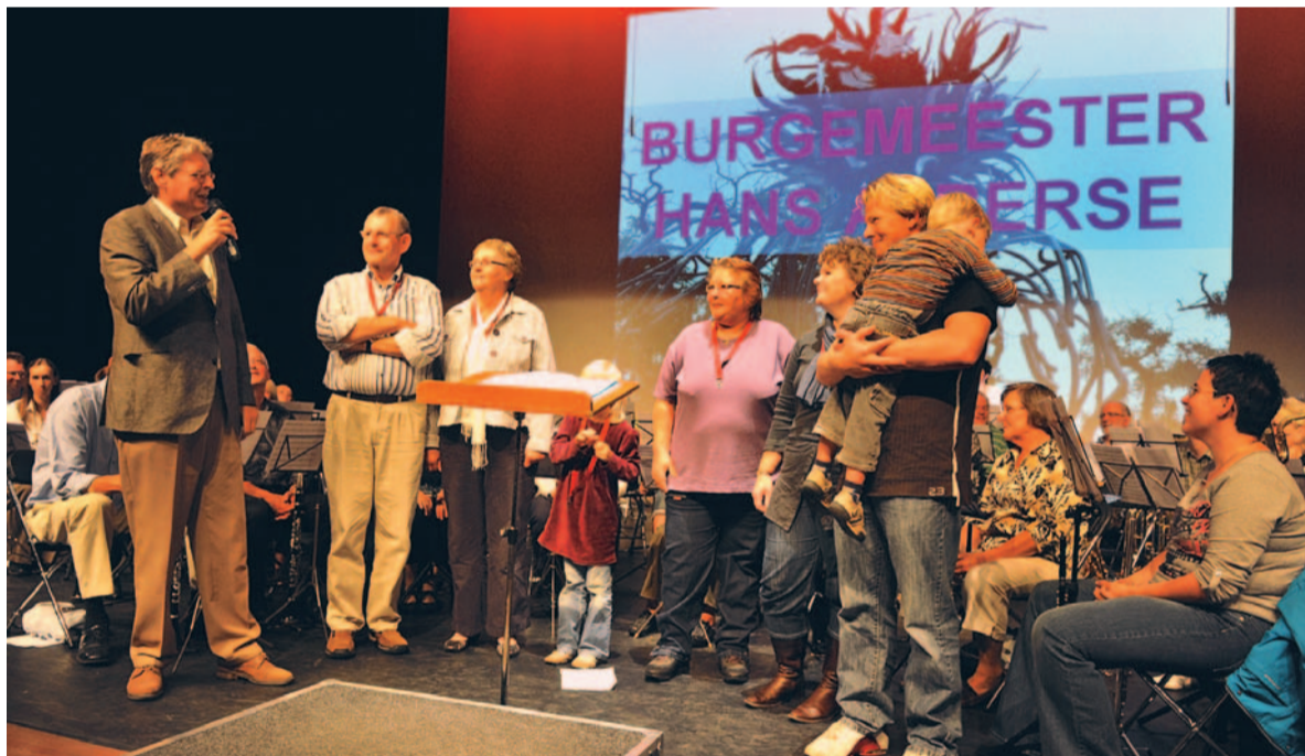
Twaalf inwoners met de naam 'Vonk' gaven gehoor aan de uitnodiging om als VIP bij de opening aanwezig te zijn.

Alle inwoners van Oude IJsselstreek met de achternaam 'Vonk' werden persoonlijk uitgenodigd om bij de start van het IJzerfestival aanwezig te zijn. Burgemeester Alberse overhandigde hen een speciaal voor deze gelegenheid door Henk Beunk geschreven gedicht. Vervolgens konden ook de 'Vonken' genieten van de opening van het VONK! IJzerfestival.