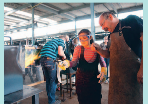
De hele week zijn er tussen 9.00 en 11.30 uur en tussen 13.15 - 15.45 uur (niet op woensdagmiddag) nog kinderen aan het smeden. Komt u vooral een kijkje nemen. Woensdagmiddag en zaterdag kunnen kinderen komen smeden, die nog niet geweest zijn.

In totaal komen deze week ruim 500 leerlingen naar het DRU terrein. Naast het smeden, mogen de leerlingen meehelpen bij het vormen en gieten van ijzer. En de meer ervaren leerlingen van de Bedrijfsschool Anton Tijdink en de Wesenthorst helpen hen bij het plaatwerken. Het resultaat van alle inspanningen, onder andere een sleutelhanger met hun eigen naam en een olifantje, mogen de leerlingen als herinnering aan deze bijzondere schooldag mee naar huis nemen.