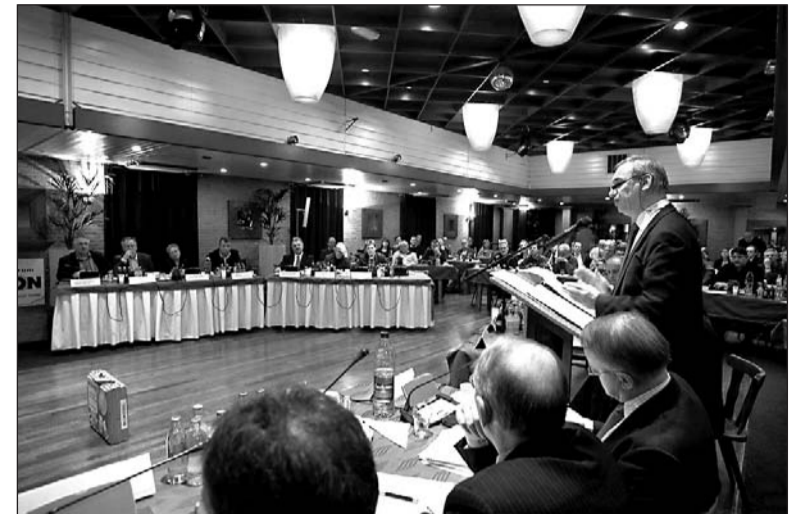
• De raad vergaderde vorige week in zaal De Zon in Varsseveld

Met een meerderheid van stemmen is tijdens de vergadering een motie van