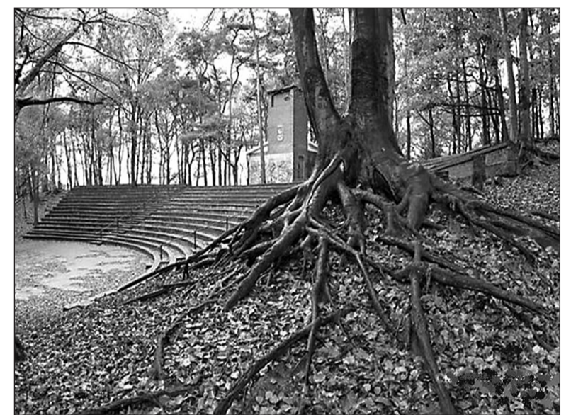
• Engbergen is één van de initiatieven waar de gemeente een vitaal en leefbaar buitengebied wil realiseren

In 2008 is een vernieuwde gemeentelijke website gelanceerd. In 2009 investeert de gemeente verder in de kwaliteit van haar website en in de verbetering van de digitale dienstverlening. U kunt met behulp van DigiD inmiddels een aantal producten aanvragen en afrekenen via de website. Deze service wordt in 2009 verder uitgebreid. Ook investeert de gemeente in het contact met haar inwoners. Hoe betrekken we inwoners meer bij plannen en hoe krijgen ze meer invloed op het beleid? De gemeente start in 2009 hiervoor een nieuw traject.