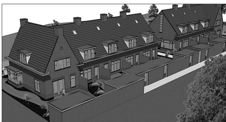
• Een ontwerp van de starterswoningen van het plan Kerkhof in Westendorp

In Westendorp en Netterden zijn de plannen klaar voor de bouw van een flink aantal woningen. In Megchelen wordt na de verplaatsing van Kiwitz met woningbouw gestart. Ook Varsseveld krijgt, na de besluitvorming over het dorpswoning, nieuwe woningen. In 2009 worden de eerste kavels uitgegeven voor Lenteleven (Gendringen) en in Silvolde komt een nieuwe woonwijk nabij het Terborgse Veld. In Varsseveld worden naar verwachting in de 2e helft van 2009 de eerste kavels uitgegeven voor het gebied Essenkampschool en in het centrum van Terborg komt extra woningbouw. Onlangs zijn de werkzaamheden voor het plan Schimmels III in Etten gestart. Verder krijgt de Vogelbuurt in Ulft een grondige opknappbeurt. In 2009 wordt gestart met renovatie en groot onderhoud aan de woningen. In het aangrenzende Biezenakker komt nieuwbouw en een nieuwe multifunctionele accommodatie. In 2009 wordt het bestemmingsplan hiervoor ter inzage gelegd.