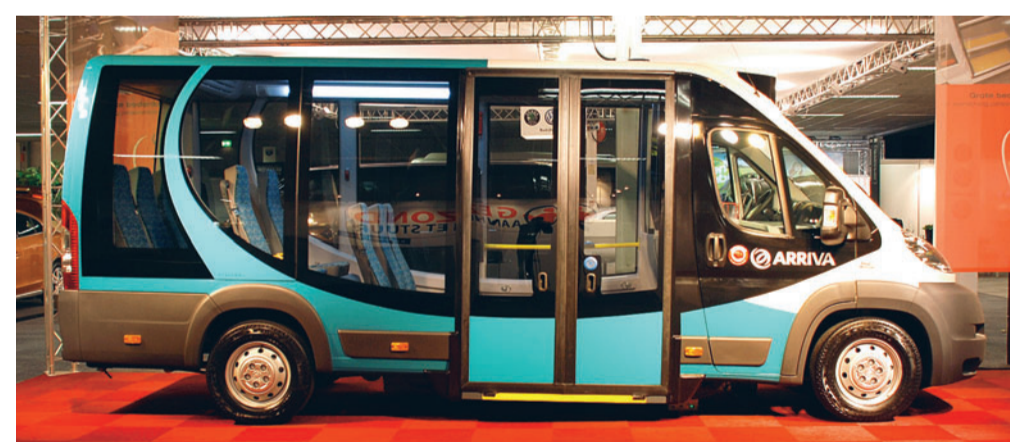
De diensten van de Huntenbuslijn worden gereden met een Lagevloerbus, een bus met een gemakkelijke in- en uitstap.

De Huntenbus en buurtbus Zelhemaalten rijden op werkdagen van ongeveer 07.00 tot 19.00 uur. Daarna rijden de buurtbussen als Belbus op afspraak: 's avonds (tot 23.00 uur), zaterdags (van 08.00 - 23.00 uur) en zondags (10.00 - 23.00 uur). De Belbus rijdt alleen als er reizigers zijn. Tot uiterlijk één uur voor vertrek kan de Belbus worden gereserveerd via telefoonnummer (0900) 1961. Buurtbus Zelhemaalten heeft afwijkende tijden 's avonds en zaterdags.